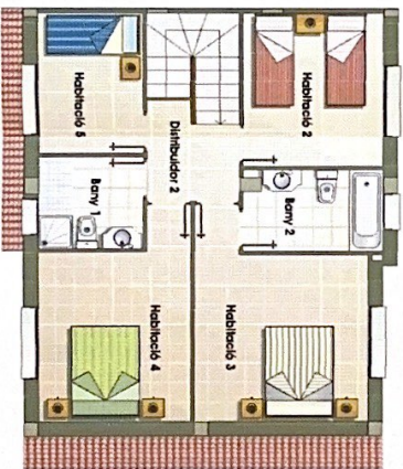
Planta Primera Sup. Construïda : 67,55 m 2